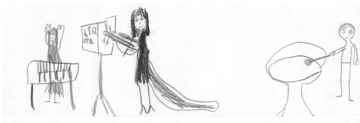
Hela: Mama w operze i koncertuje

Równocześnie z podjęciem pracy postanowiłam znaleźć jakieś zajęcia dla moich dzieci. Były to Grupy Zabawowe, które dały mi możliwość doksztalcenia się jako rodzic. Nauczyłam się „zdań-kluczy” i tego, jak radzić sobie z buntem dwulatka. Dzięki temu zaczęłam też dbać o swój czas wolny, w którym czytam książki.